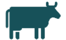
Carne y cuero